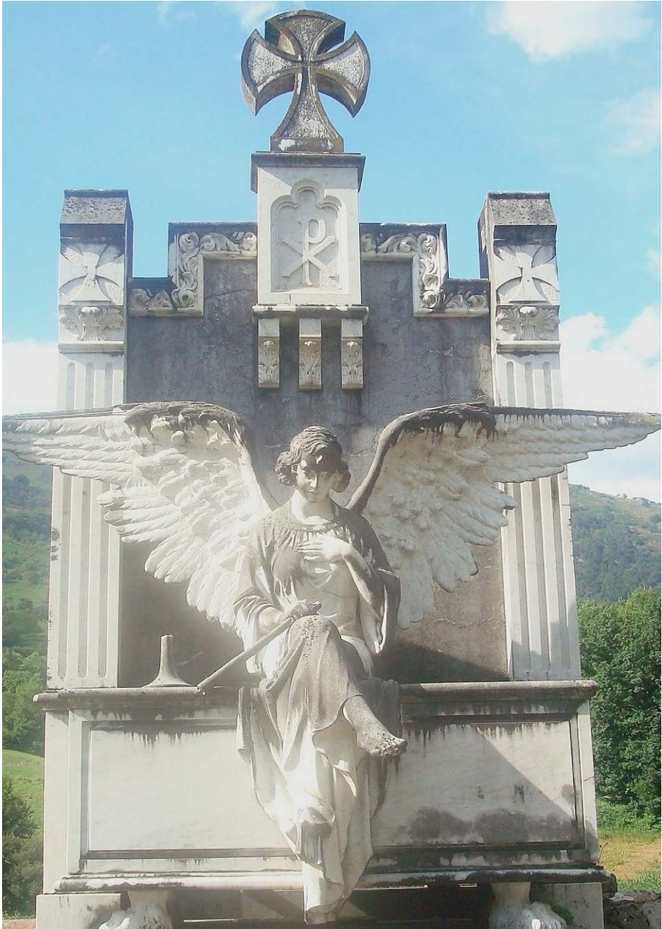
Figura 6. Detalle del panteón de Ituren.