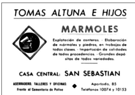
Figura 1. Anuncio publicitario de la empresa Tomás Altuna.