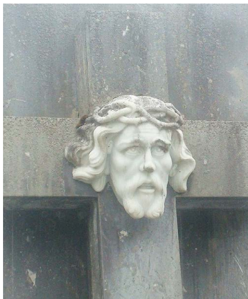
Figura 3. Ejemplo de tipo escultórico en cruz.

zos de la Cruz que preside el conjunto; finalmente, en el panteón de Igantzi aparece otra imagen con el rostro de Cristo (fig. 3). Estas obras reseñadas resultan bastante modestas y prima ante todo el conjunto arquitectónico. Existe también algún panteón sin ornato escultórico, como son los casos de los panteones 2 y 3 de Arizkun (que con seguridad parecen haber sido reformados), el panteón 3 en Bera (que parece haber perdido algún elemento decorativo que pudo llevar quizás en la cruz) y el de Oiategi.