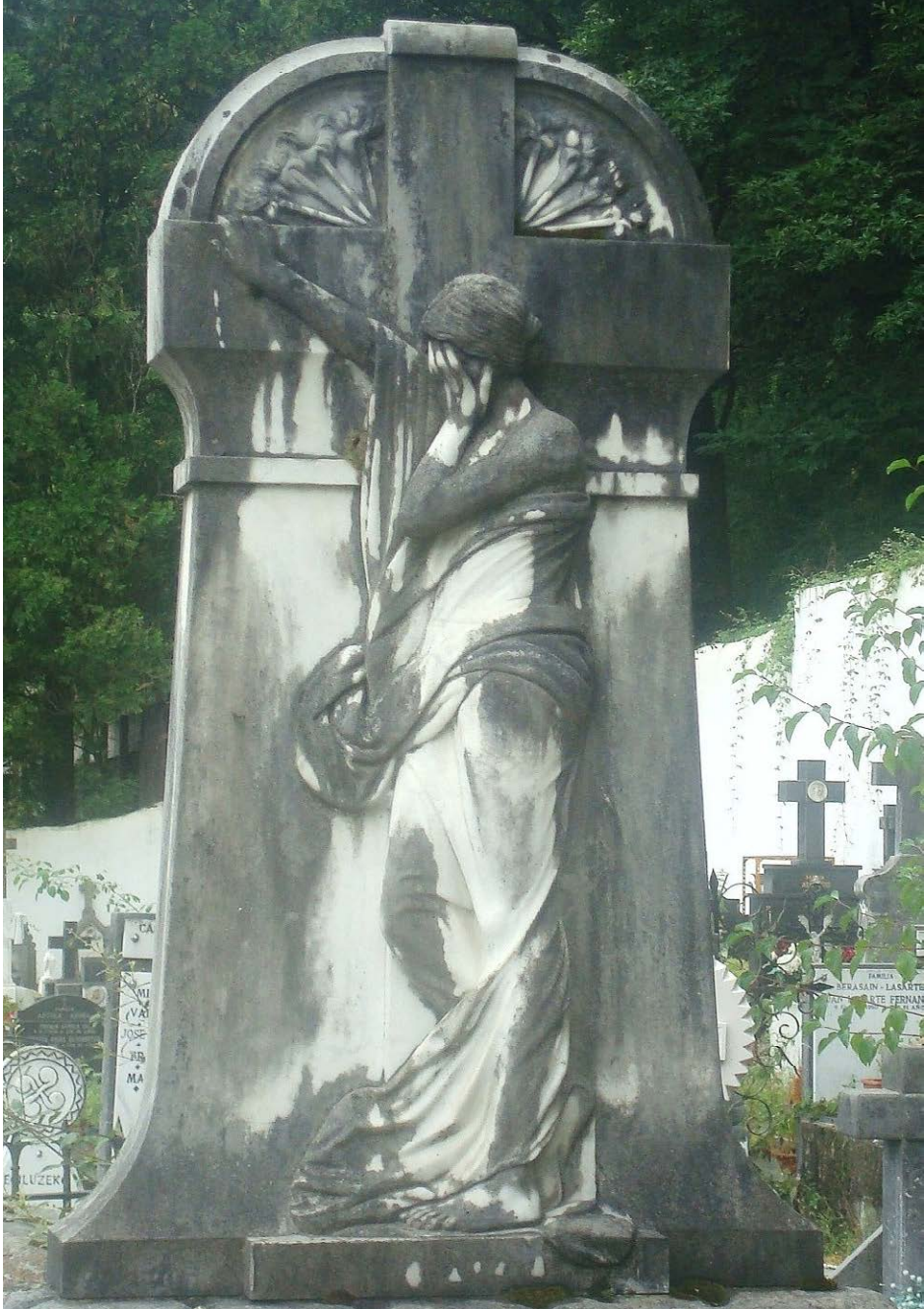
Figura 4. Relieve de Tomás de Altuna en el cementerio de Bera.