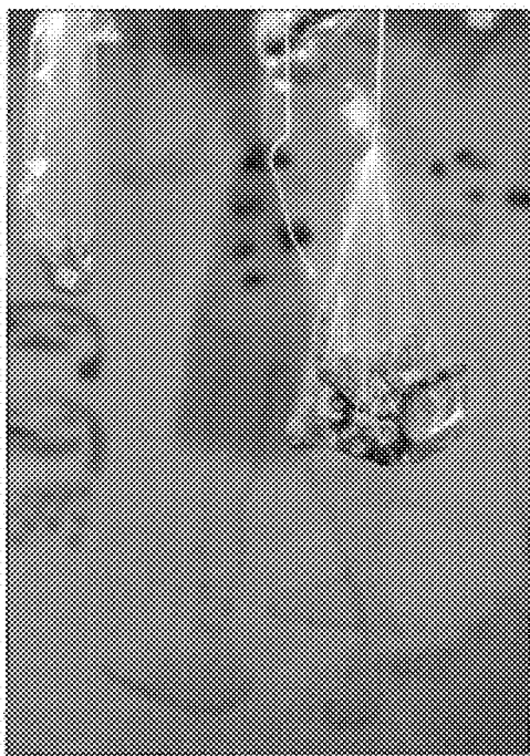
Objetos cotidianos convertidos en objetos artísticos

Así, la biblioteca infantil de la Fundación Germán Sánchez Ruipérez se convierte cada verano en un espacio de experimentación que nos permite conjugar la literatura con temas de actualidad o de interés para los lectores, ayudándoles a descubrir diversidad de propuestas de lectura.