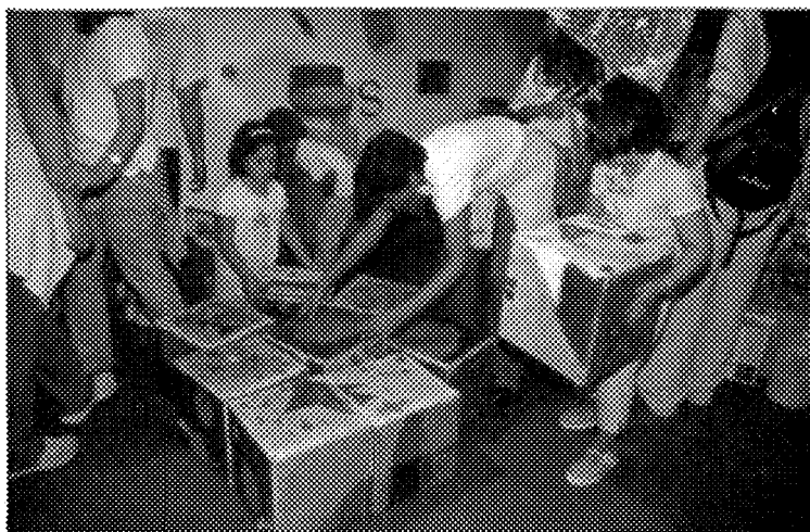
Romper los moldes: el volumen

Durante este tiempo, comenzaron a elaborar un Cuaderno de apuntes del artista , que les acompañaría durante las tres semanas siguientes. En él debían recoger información de los libros sobre el artista contemporáneo que ellos elegían y expresar de forma plástica, a partir de nuestras sugerencias, cómo representarían diferentes cosas, utilizando su técnica, su estilo propio, sus materiales habituales, etcétera. Así, además de adquirir conocimientos sobre algunos pintores, escultores o arquitectos, se debían fijar en su forma de crear, con el fin de