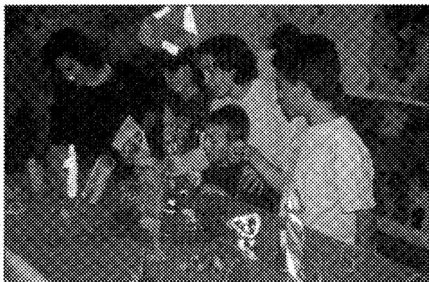
El rincón de la mirada

Estos tres espacios ofrecían una dinámica distinta cada día, a partir de una programación de objetivos y actividades que se estructuraba en torno a varios aspectos: