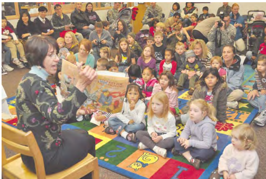
Imagen: Youngs at Library.

¿Y qué será lo nuestro en 2029? Lo mismo que ahora. Abrir puertas. Comunicar persona. Aportar VALOR HUMANO a la sociedad.