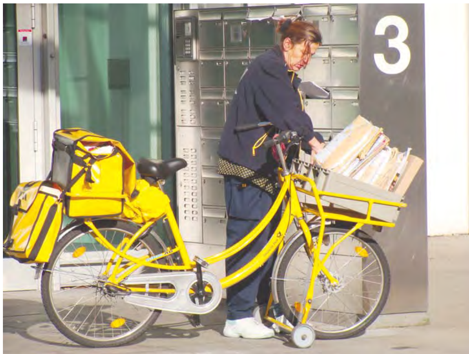
Imagen: Post cycle Cologne

... también un medio para comunicar individualidades: la del autor y el lector, las del ayer y el hoy, las de culturas remotas,