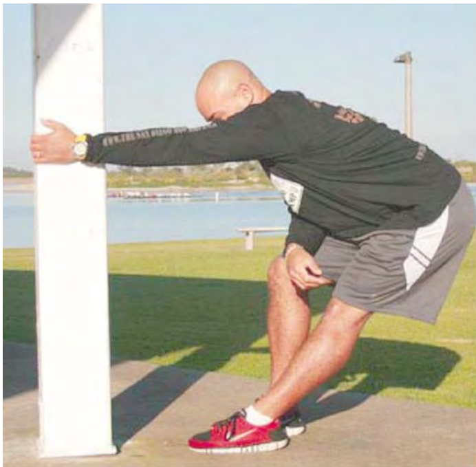
Imagen: sin créditos.