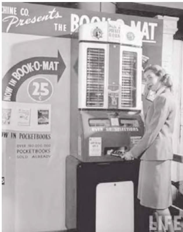
La Book-O-Mat expendedora de libros en 1949. Revista LIFE.

Por otra parte, esta situación parece poner en entredicho los servicios bibliotecarios presenciales. A medida que se desarrolla el automatismo (máquinas de autopréstamo, catálogos virtuales, servicios de referencia a distancia...), se cuestiona la utilidad del bibliotecario y, claro está, la de las propias bibliotecas.