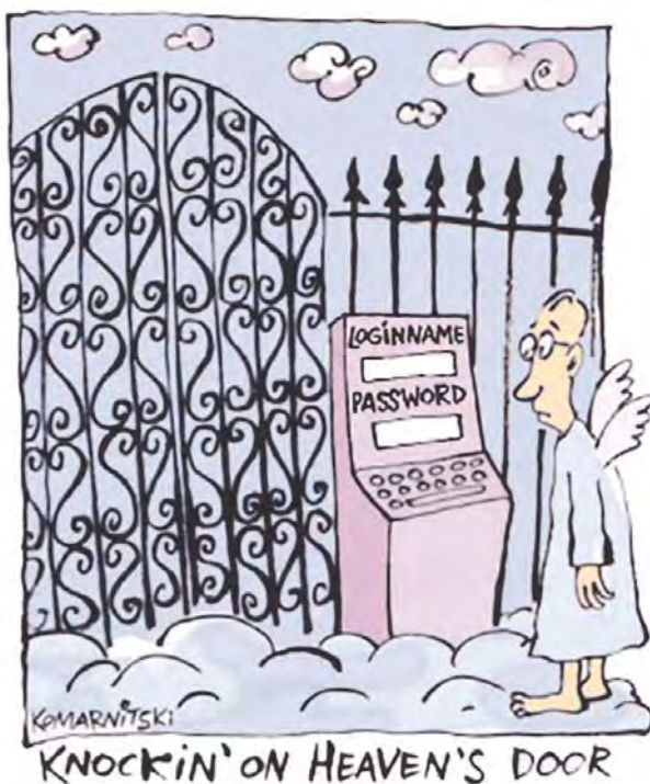
Imagen: Christo Komarnitski ( https://www.elance.com/s/komarnitski/ )

...porque hay una brecha que impide llegar hasta esa puerta. Es una entrada reservada. De difícil acceso público. Sin santo y seña no se puede entrar.