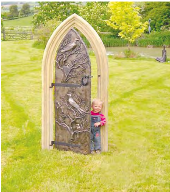
Imagen: Secret Garden Door. Fuente: Wikimedia Autor: Hannahlucy100. Licencia CC BY-SA

También puede llenar nuestra cabeza de preguntas