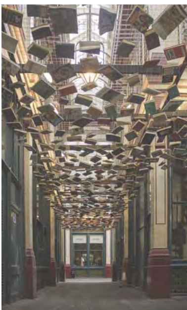
Imagen: Booksky. Autor: Atropos91 Licencia CC BY-NC. Fuente: Flickr.