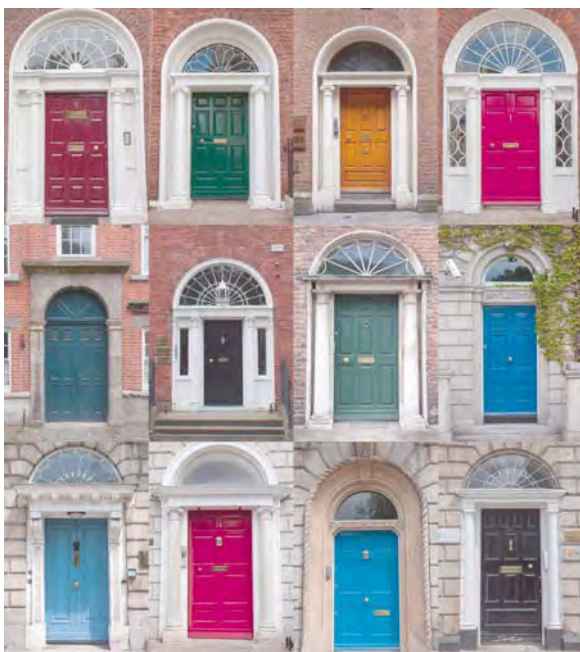
Imagen: The Doors of Dublin. Autor: Tim Sackton Licencia CC BY-SA. Fuente: Flickr.

La biblioteca sólo seguirá siendo biblioteca si recordamos que es mucho más que "un local donde se tiene un considerable número de libros ordenados para la lectura".