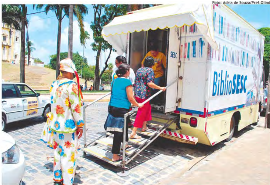
Imagen: Biblioteca móvil em Olinda, Pernambuco, Brasil. Origen: Flickr. Autor: Prefeitura de Olinda. Licencia CC BY

...acercar los libros y la lectura a quienes más difícil lo tienen. La biblioteca debe ser una ocasión para acceder a la información y a la cultura.