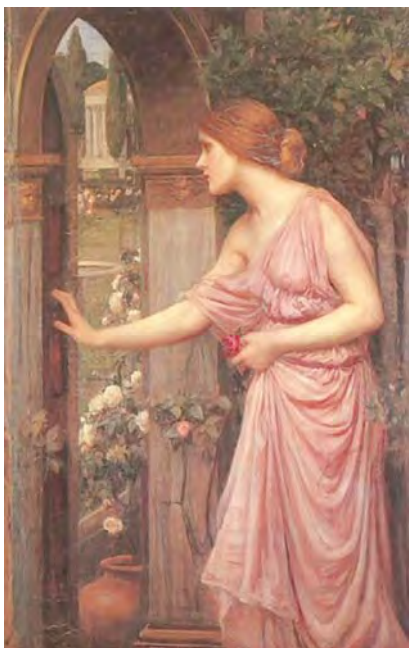
Imagen: Psyche, de John William Waterhouse, Harris Museum. Dominio público.

Me gusta ser bibliotecaria. Es un trabajo muy humano, permite estar cerca de la gente, que es siempre gente interesante. Gracias a eso, a veces se viven escenas maravillosas, cálidas, que te hacen sentir en la gloria. Saltándonos el criterio de rentabilidad, aquella semana decidimos responder afirmativamente a la desiderata de un libro claramente minoritario. Tras comunicárselo al usuario demandante, recibimos la siguiente respuesta: