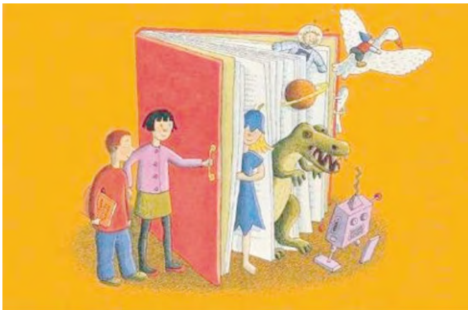
Ilustración de Leena Lumme. Sello conmemorativo del primer centenario de la Asociación finlandesa de bibliotecas.

De entre todas las metáforas relacionadas con la lectura y las bibliotecas, mi favorita es la de la "puerta". Por eso me he traído veinte de ellas a Jumilla, para compartirlas con vosotros, que me recibís con las vuestras abiertas de par en par.