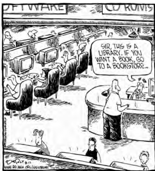
Imagen: Dave Coverly.

Tomada de http://personal.rhul.ac.uk/uhra/026/homepage.html