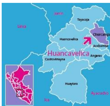
Figura 1. Mapa político de Huancavelica, Perú.

La provincia tiene nueve distritos: Chinchihuasi, Pachamarca, Paucarbamba, San Pedro de Coris, Churcampa, Paucarbambilla, Locroja, La Merced y Mayocc (3). Se encuentran comunicados por medio de carreteras sin asfaltar en condiciones medias, lo que hace que el acceso sea complicado. En la figura 1 se muestra un mapa para identificar la zona.