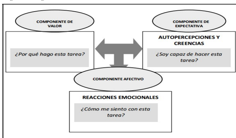
Figura 1. Los componentes de la motivación académica

Siguiendo el modelo de referencia del trabajo de Pintrich y De Groot (1990) se pueden distinguir tres componentes básicos que posee la motivación académica y que se pueden apreciar de manera más clara en la siguiente figura: