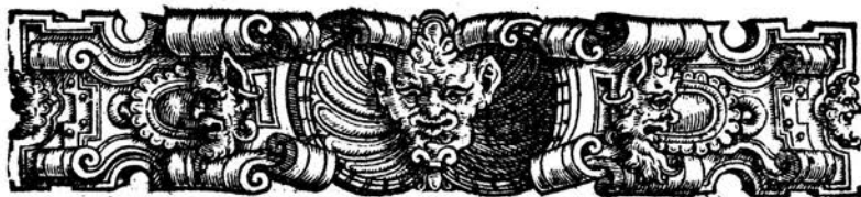
TAVOLA DI TUTTE LE COSE NOTABILI COMPRESSE NEL SÖMMARIO DELLE SCIENTIE.