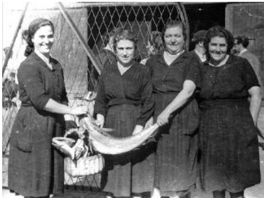
"Cooperativa de mujeres pescadoras de Trintxerpe".

nero de pescadora ya no estaba tan esclavizada, las guardias, había que ir con el pescado. Cuando era el tiempo de los pajaros, iban por los caseríos con los baldes en la cabeza hasta Ventas andando, a veces cogían el tranvía hasta Rentería y de Rentería a Oyarzun le faltaba un trozo. Andaban muy derechas y muy garbosos, muy alegres, cantaban mucho. La tristeza ya les había pasado, esto ya no era trabajo, para todo lo que habían pasado. ( Manoli Pérez Bretal, 2004 )