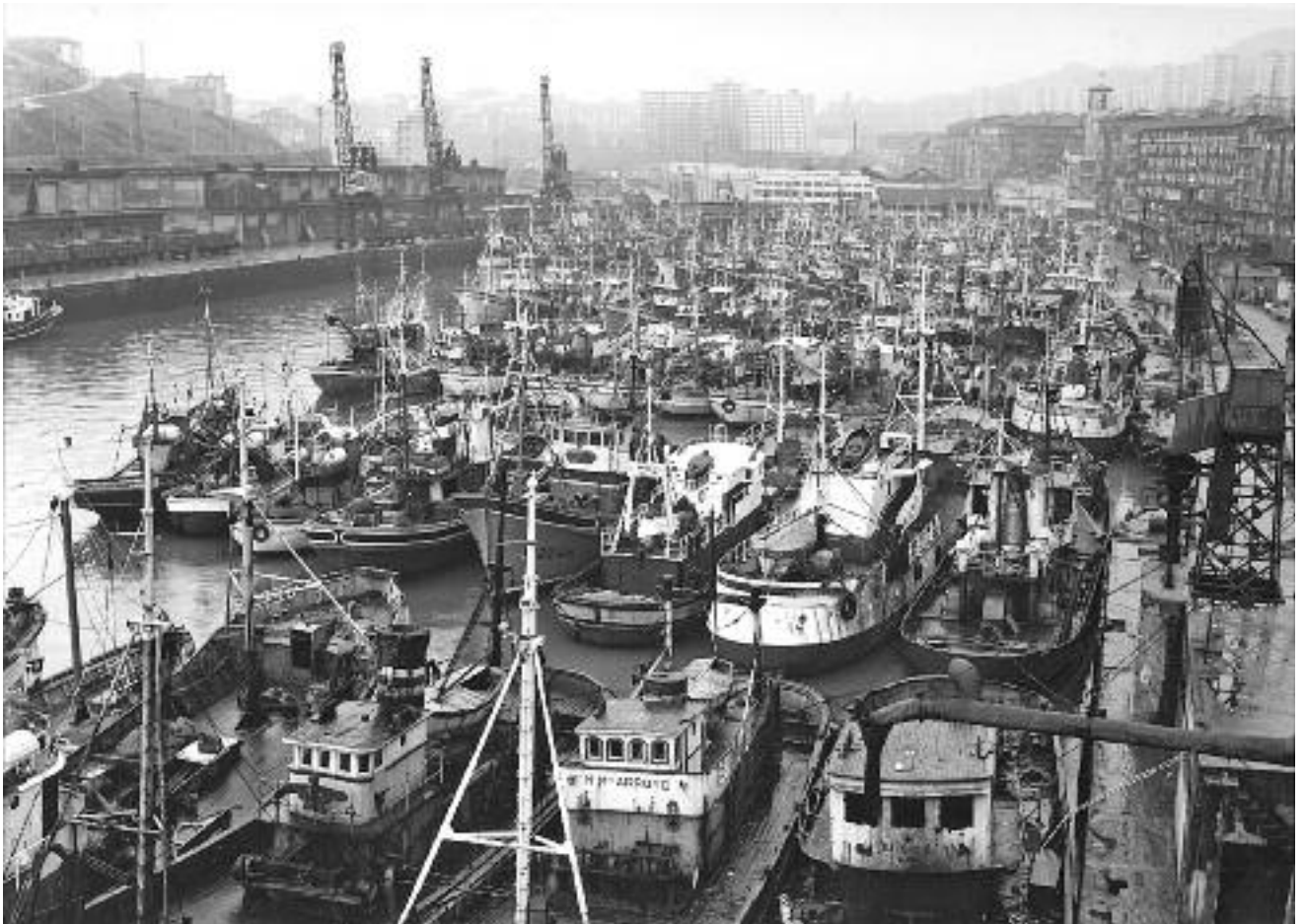
“Puerto de Pasajes en la década de los sesenta”.

García-Orellán, Rosa: La pesca industrial y la emigración gallega en Trintxerpe, 1920-1970