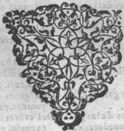
TABLA DE TODAS LAS COSAS NOTABLES QUE EN ESTE LIBRO DE AGRICULTURA SE CON-

tienen, para cuya intiligencia se ha de advertir, que la .f. signi- fica folio, la .c. columna, el cap. capitulo, la .v. vean, la palabra, alli, quiere dezir en la misma columna que inmediatamente queda referida, y quando no se refiere folio, sino columna sola, se entiende el folio que vltimamente se refirió.