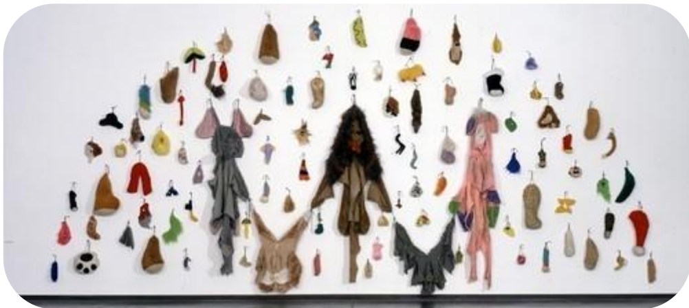
- Material 7. Obras de Anette Mesager