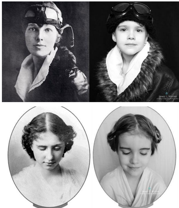
Material 9. 5

Fue entonces cuando mostró a su hija fotografías de mujeres célebres, y los méritos por los que lo eran. Posteriormente emuló dichas imágenes, con su hija como protagonista.