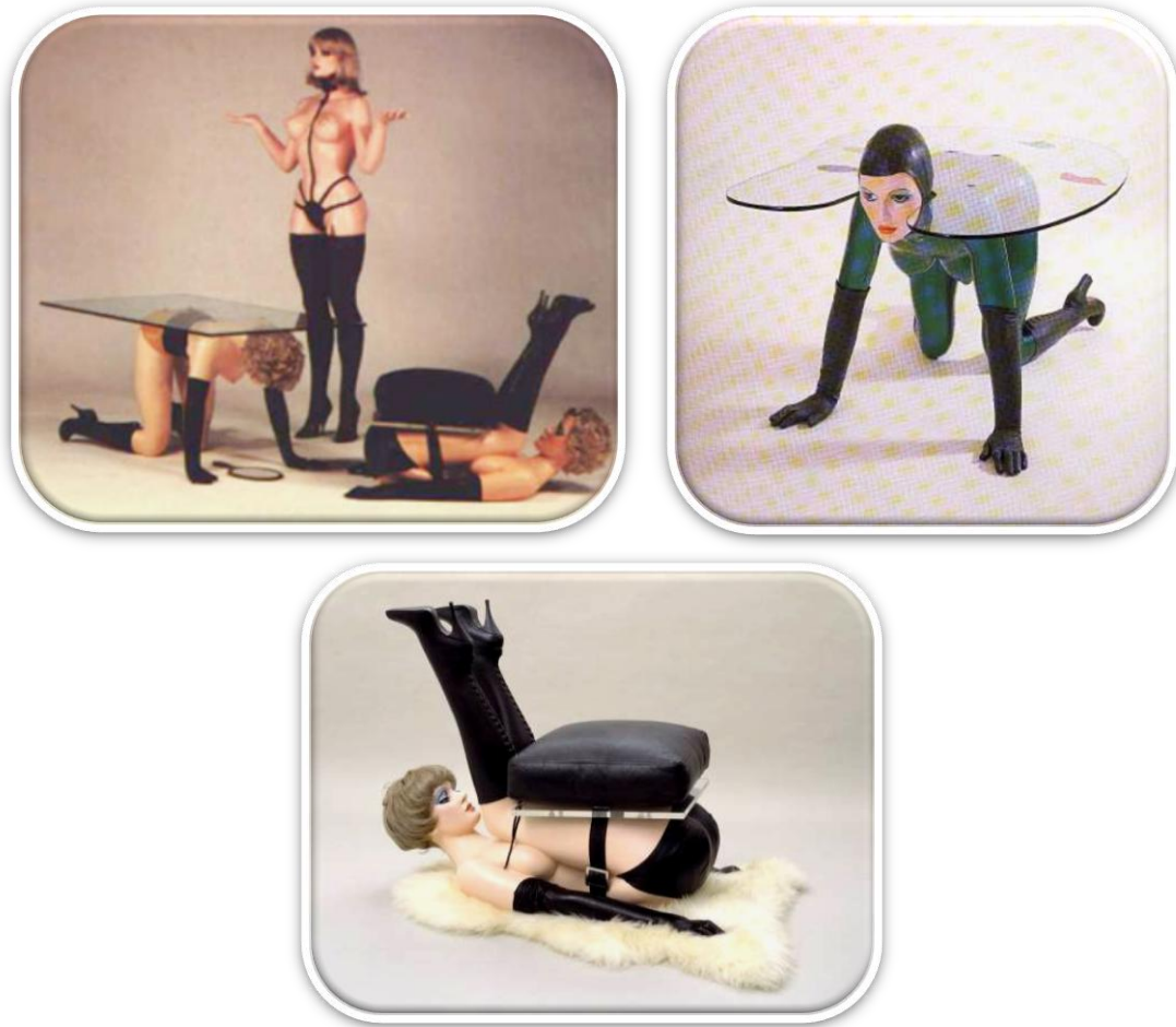
Figura 5. Fotografías de Allen Jones. Exposición “Chair, Table y Hat Stand”