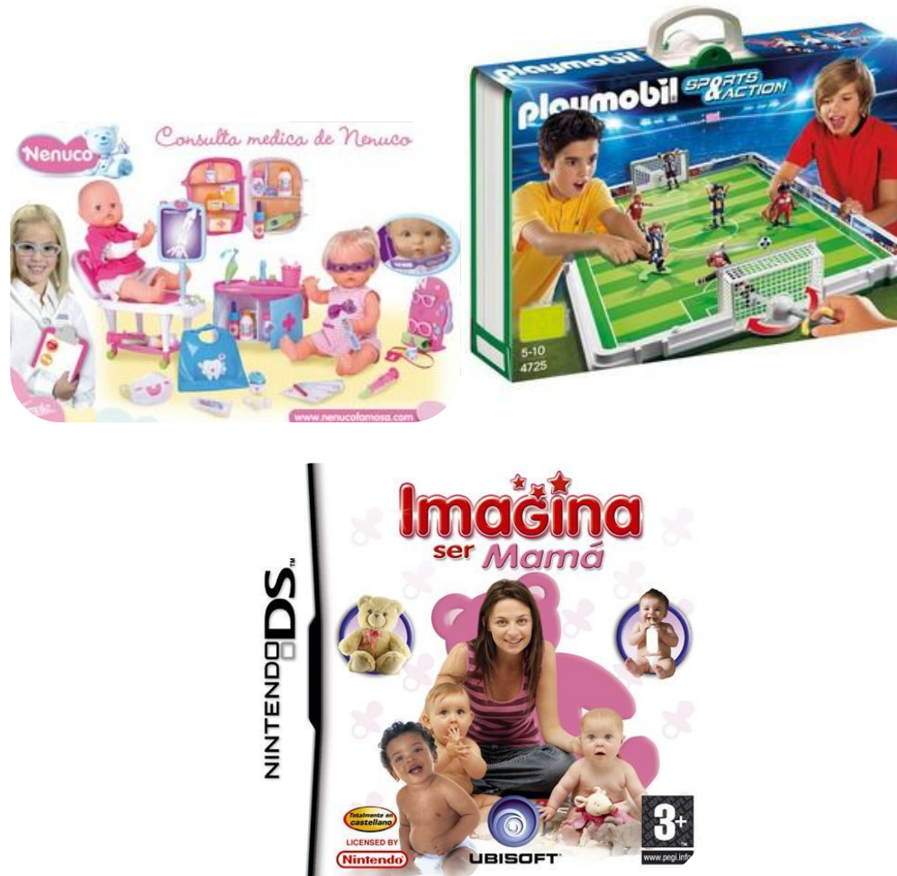
Figura 3. Anuncios publicitarios de juguetes infantiles 4

A través de esta primera tanda de imágenes podrá tratar el perfil que en la televisión se da a los niños y niñas como ellos. Se realizará la pregunta: “¿Hay juegos para chicos y juegos para chicas?”. También se podrá comentar (sobre las imágenes) si sólo las niñas quieren ser madres en el futuro, si ellas nunca han jugado a los Playmobil, o ellos a las muñecas. Posteriormente se comentarán las respuestas que se den, respetando todas las opiniones, pero intentando que los alumnos y alumnas entiendan que existen gustos personales, que cada persona tiene unas preferencias, pero que los juegos no tienen restricciones, son mixtos. La sociedad encamina al ser humano a seguir determinados roles de género, a jugar a unas u otras cosas según nuestro sexo, pero no tiene por qué ser así, y no deben reprimir sus gustos por ello. De esta