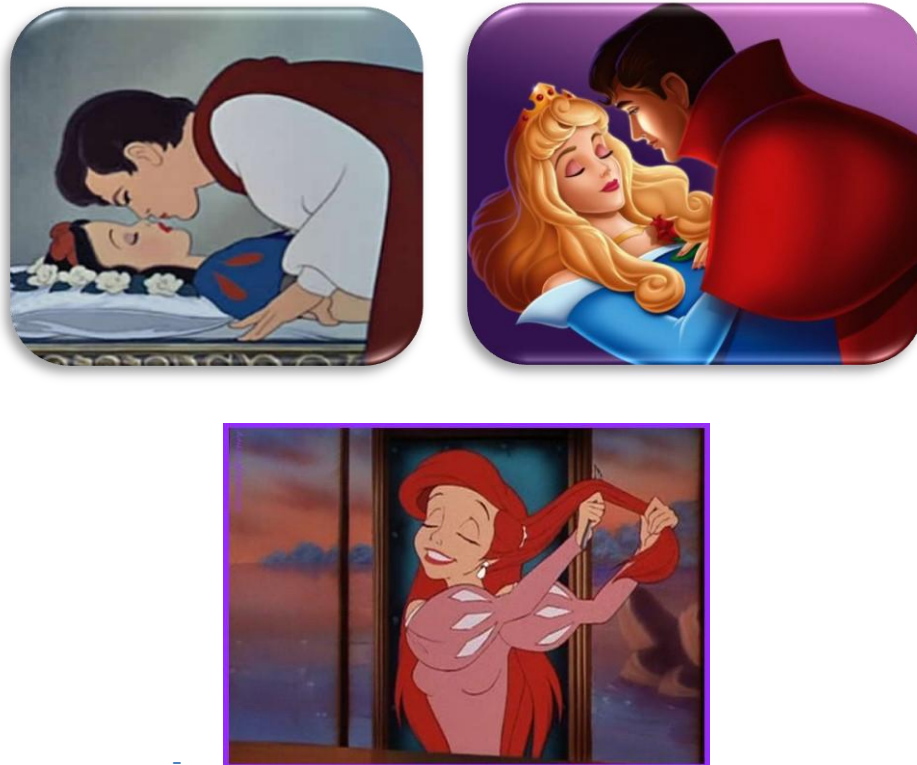
- Figura1. Películas Disney 3

A continuación se muestran algunas imágenes de películas en las que los roles de la mujer y el hombre están muy marcados siguiendo una visión tradicional de los mismos. Todas las películas de las que se han extraído están realizadas para un público infantil, pero tanto las familias como los centros escolares deberían preguntarse si los valores que éstas inculcan son los que se quiere transmitir a los niños y niñas.