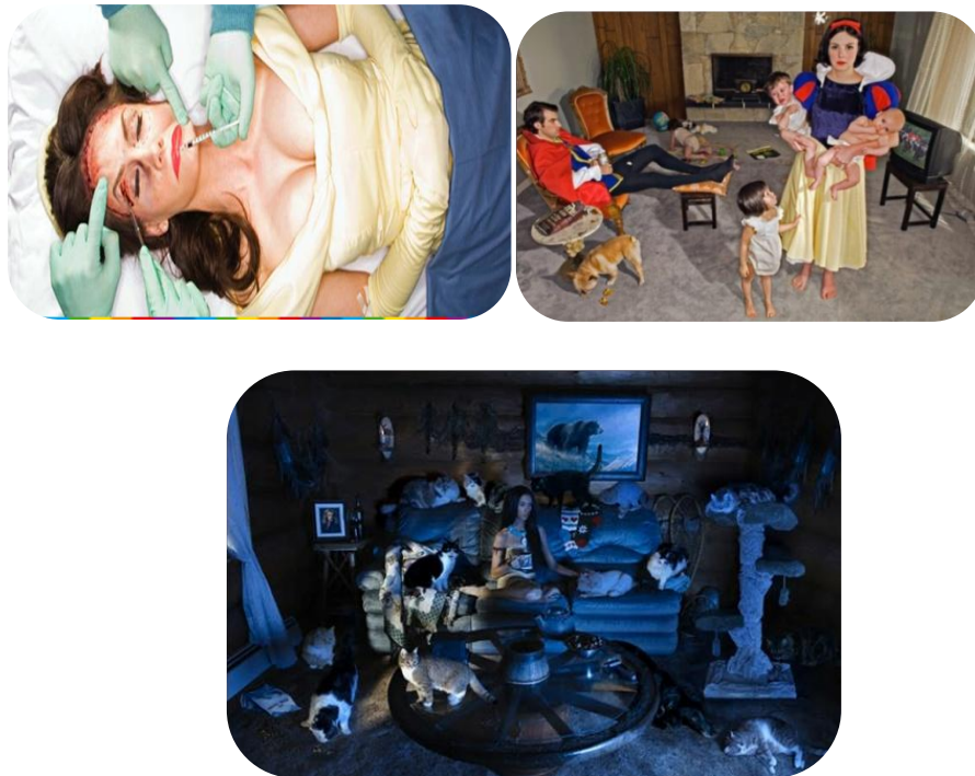
Figura 2. Dina Goldstein, “Las princesas caídas”

Tras mostrar las imágenes se preguntará al alumnado si son las mismas princesas las que ven en la primera y segunda tanda de fotografías y qué les diferencia. Normalmente si no se reflexiona sobre el material que se presenta se está perdiendo un rico trabajo basado en la opinión y aportaciones de todos los niños y niñas. Es necesario que se acostumbren a observar las obras con detenimiento, fijándose en los detalles, y aprendiendo a comparar unas con otras. De esta forma los alumnos y alumnas tomarán conciencia de los materiales que les son presentados y realizarán el mismo proceso ante las imágenes que reciben en su vida diaria. Además en gran grupo se reflexionará sobre si la vida de las mujeres es tan sencilla como en las películas, si sus únicas preocupaciones son estar bellas para su marido y no tienen ninguna otra ocupación. Para ello podrán poner ejemplos de mujeres como ellas mismas, sus madres, abuelas... y reflexionar si sus vidas son tan sencillas como las muestra Disney.