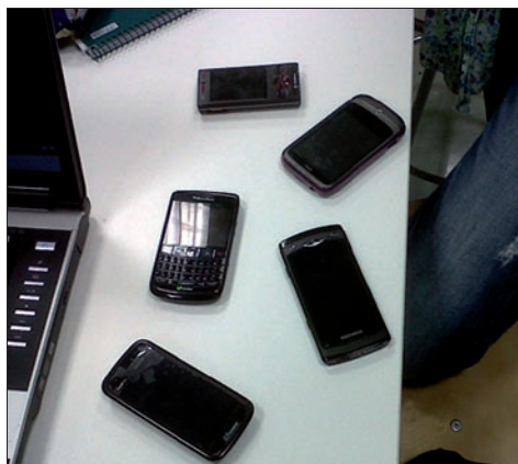
Figura 4. Trabajando colaborativamente en el aula.

Así pues, ante una disputa patente conocida por todos los valencianos desde hace años, se plantea desde la asignatura de Didáctica de la Expresión Plástica y Visual el proyecto nº 2 de su programación: El paisaje urbano , dentro del cual trataremos esta temática social fundamentada en la división de intereses y opiniones.