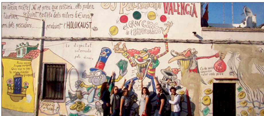
Figura 10. Componentes de un grupo junto al mural titulado “El Gran circo de la especulación”.

Todos los grupos coincidieron en señalar que hasta no adentrarse en la realización del trabajo y generar sus propias propuestas no habían alcanzado a entender en su totalidad la relación entre la temática elegida para la propuesta y la asignatura. El proyecto les ofreció una nueva perspectiva, no solo respecto al uso de las tecnologías sino al nuevo enfoque que puede recibir el área.