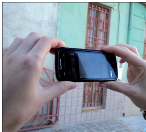
Figura 3. Alumnado captando imágenes de algunos aspectos de la problemática del barrio valenciano.

Los participantes se mostraron receptivos a la experiencia desde el primer momento, aunque inicialmente no entendían el trabajo de investigación, de manera que algunas cuestiones se fueron comprendiendo a lo largo del proceso.