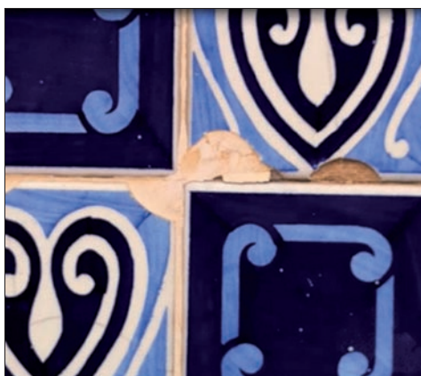
Figura 8. Detalle de uno de los azulejos que reflejan la influencia Modernista del barrio.

He elegido como tema de mi trabajo sobre el Cabanyal el patrimonio artístico de este barrio y el peligro al que se ve sometido por la amenaza de su destrucción, de su abandono. De hecho, el vídeo empieza con una vista general de los lugares y de las casas que más me llamaron la atención, casas típicas de este barrio marinero. Después decidí centrarme en las mezclas tan variadas de colores que forman los numerosos mosaicos de azulejos que podemos ver en las fachadas y que se han convertido en una de las características más destacables de estas casas. A continuación he incorporado al vídeo las fotografías de los solares, de las partes derrocadas y de las puertas y ventanas que han sido tapiadas por miedo a que sean ocupadas ilegalmente. Por este motivo he decidido utilizar para estas fotografías el blanco y negro, para simbolizar el sentimiento negativo que se deriva de ellas, la nostalgia, el vacío que dejan las casas cuando las derrocan. El paso de las fotografías de color a las fotografías en blanco y negro en el trabajo viene dado a raíz de una imagen donde aparecen azulejos decorativos rotos. Con esta imagen que pasa del color al blanco y negro, he intentado recalcar la temática de mi trabajo, la destrucción de un patrimonio artístico tan valioso cómo es el del Cabanyal.