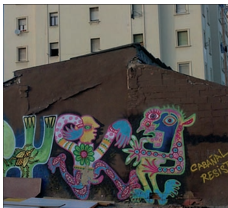
Figura 7. Uno de los murales que alientan a mantenerse firmes en sus convicciones.