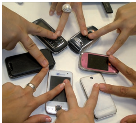
Figura 2. Imagen producida por el propio alumnado.

Resulta además indispensable referirnos a las interferencias que en nuestros contextos educativos ha supuesto la evolución del universo Internet. Facilita nuevas maneras de comprender la didáctica, la pedagogía y el arte (Escala, 2010).