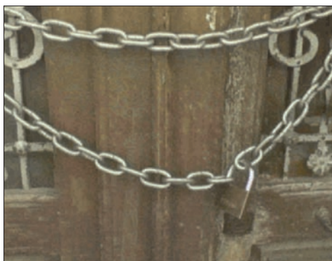
Figura 9. Una de las casas abandonadas encadenadas con el fin de que no las ocupen.

“Miráis lo que hay allí, y si pensáis que cualquier persona puede convivir con eso, entonces ya está contestado todo”.