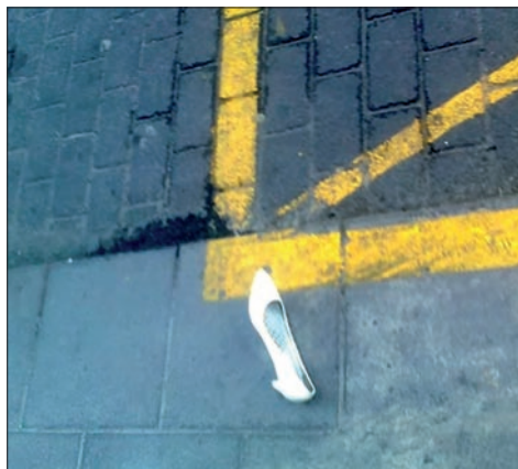
Figura 6. Imagen con connotaciones a la prostitución y los proxenetas.