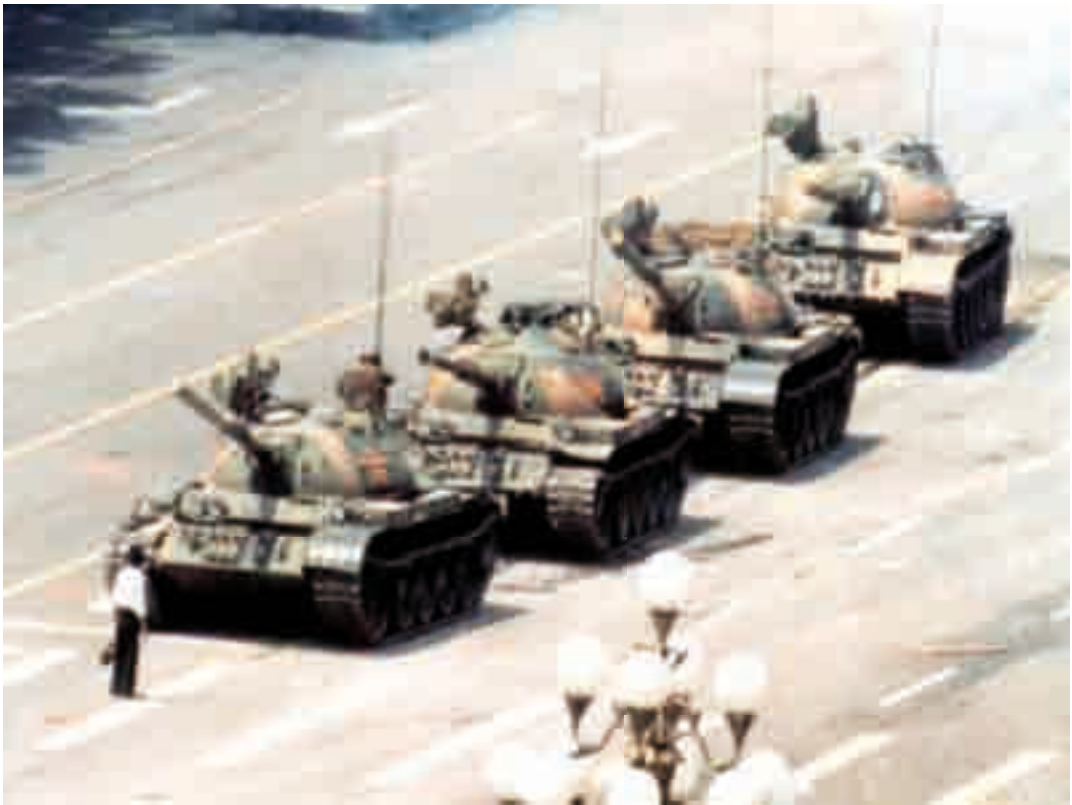
Fotografía del héroe de Tianamen, tomada por Jeff Widener para la agencia Associated Press el 5 de junio de 1989.

precisamente es la coraza (hiper-real) la que estrecha el campo de la visión natural (imposibilitando o mediando el contacto humano) por lo que se precisa de un agudizamiento electro-mecánico de la visión (puntería) 78 anulada por esa apabullante super-carnalidad. La puntería necesita ver poco 79 ; o como dirá el mismo Virilio: “La ceguera se encuentra, pues, en el corazón del dispositivo de la próxima máquina de visión y la producción de una visión sin mirada ya no es en sí misma más que la reproducción de una intensa ceguera; ceguera que se convertirá en una nueva y última forma de industrialización: la industrialización de la no mirada” (loc. cit.: 13); más bien es reductora del campo en el tubo alargado de la mirilla, y necesitada de guía (lumínica) o referencial (geométrica y balística). Una puntería no sólo del objeto estático, sino del seguimiento, del movimiento, de la potencia y la velocidad. El revólver fotográfico de J. C. Janssen (1874) y el fusil fotográfico de É.-J. Marey (1882) aseguran una retina científica del movimiento (cronofotografía). Antes que en la livianidad optocinética nos detenemos en el peso volumétrico de una ciencia que es requisito fundador de las aceleraciones posteriores, y que resiste su remoción. La hombría sólo se muestra -por supuesto que ironizamos- en la contundencia del fuerte; no en la habilidad del débil 80 . No obstante, Virilio (loc. cit.: 10-11) tiene razón en considerar la guerra contemporánea como