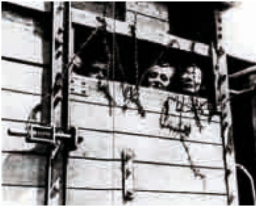
Fotografía de deportados en vagones camino de los campos de exterminio (s. d.).