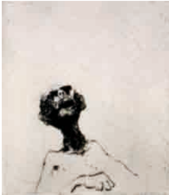
Zoran Mušič, We Are Not the Last , 1975. Litografía en papel.