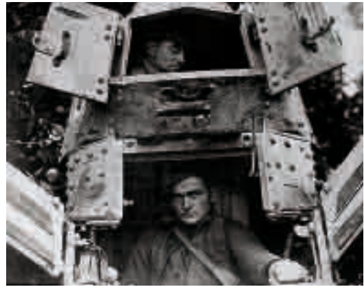
With the Americans northwest of Verdun. The skipper and gunner of a 'whippet' tank, with the hatches open. Francia, 1918 (s. d.).