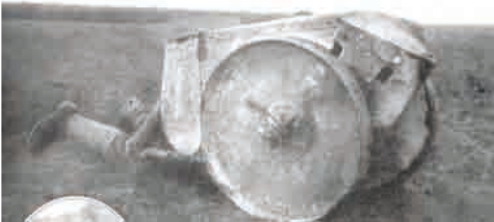
Soldado francés en un hombre-blindado u hombre-tanque (The New York Time, 25 de febrero de 1917).

emocional y moral estaba sometida a un stress mecánico del que no debía desencadenarse 69 .