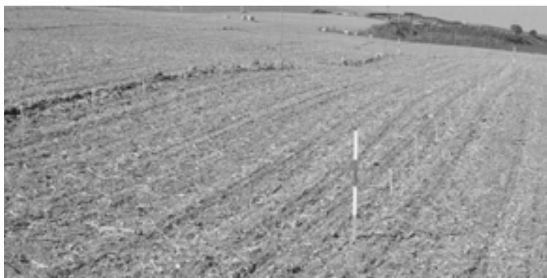
Figura 1. Aspecto general de la prueba.

2.2. Diseño experimental. Se trata de una prueba con una única repetición de cada tratamiento herbicida. Cada tratamiento herbicida se alterna con un testigo sin herbicida.