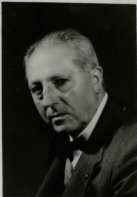
Leoncio Urabayen en 1952