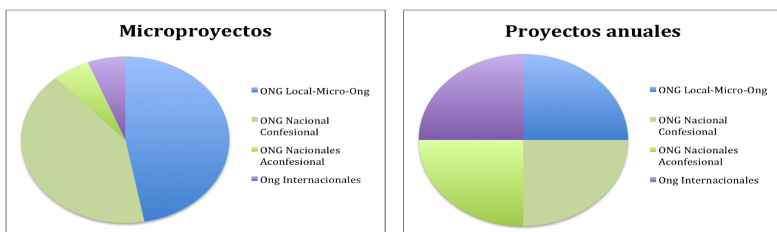
Gráfico 3: Convocatoria de 2010 del Gobierno de La Rioja para subvenciones en los Proyectos de Ejecución Anual y en la Microproyectos