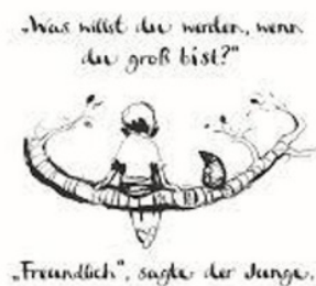
(d) Traducción al alemán.