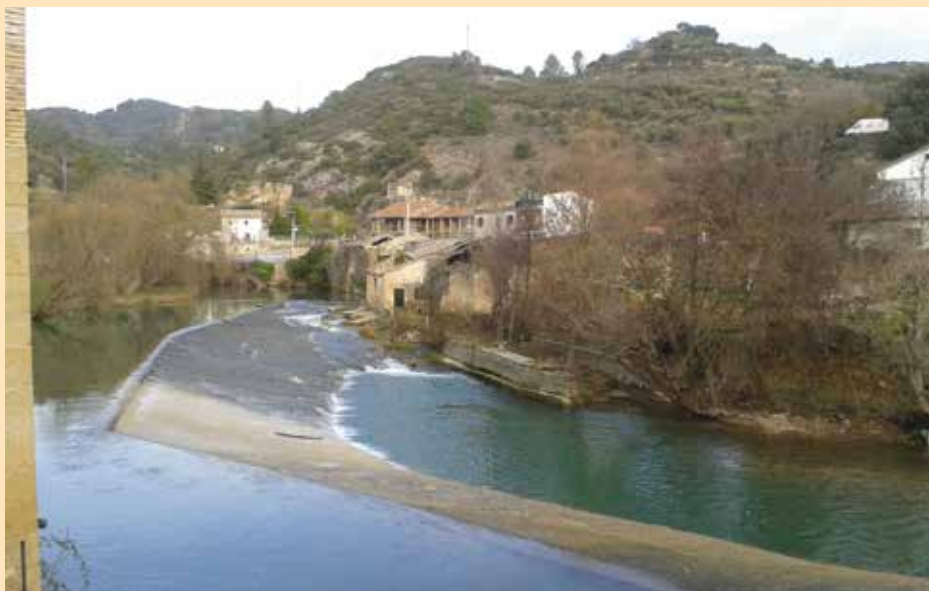
Figura 6. Vista desde el río de las ruinas de lo que fueron la almazara municipal y la fábrica y lavadero de Isidro Antonio Llorente, con el canal y enlosado construido por éste.