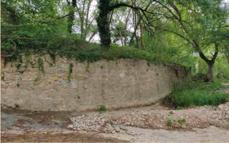
Figura 3. Ruinas del batán de Abajo, en la Pieza del Conde, convertido durante el siglo XIX en la fábrica de hilados de Álvaro Lorente.