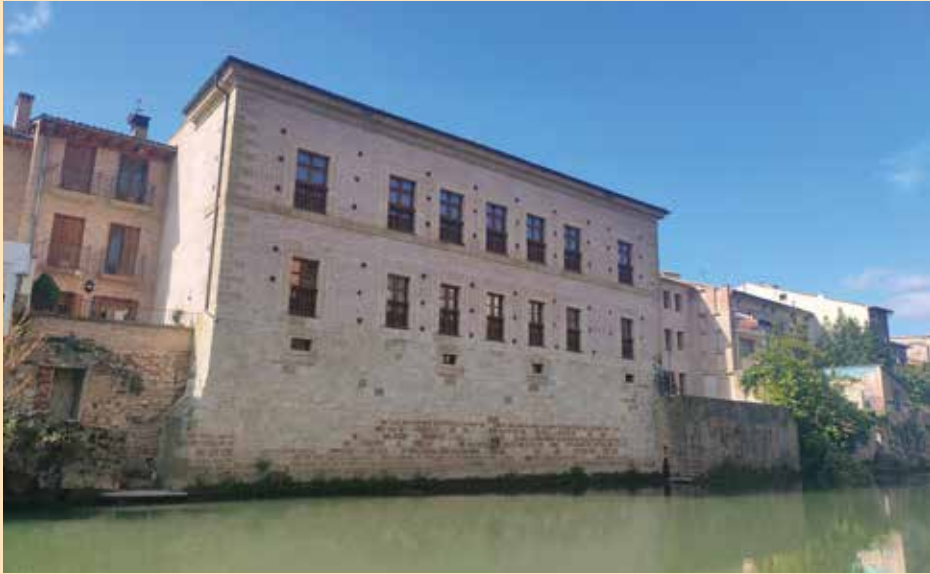
Figura 4. Fachada posterior del edificio que albergó desde septiembre de 1773 la fábrica de tejidos de Lorenzo Esteban Iriarte, Manuel Modet y compañía.