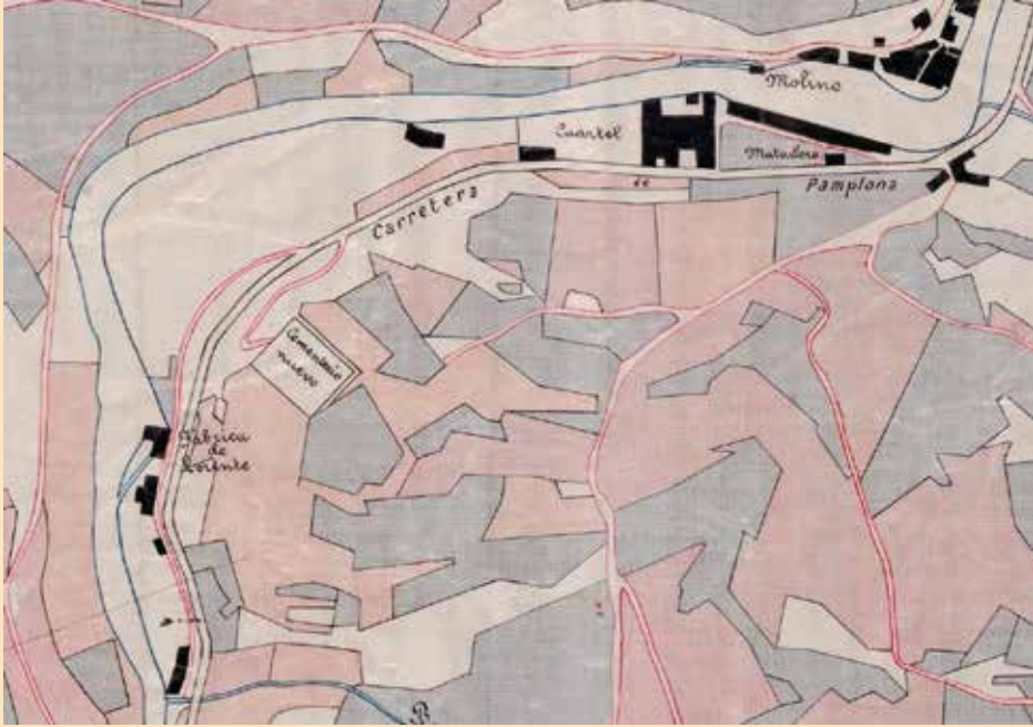
Figura 7. Fragmento del plano del catastro provincial por masas de cultivo de la década de 1880 en el que se sitúa la fábrica de Álvaro Lorente en el emplazamiento del antiguo batán de Abajo. La silueta de la antigua fábrica de Isidro A. Llorente se advierte en la parte superior derecha, entre el molino y el matadero.