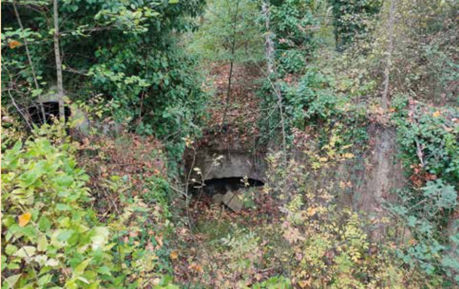
Figura 8. Ruinas de la fábrica de Álvaro Lorente (antiguo batán de Abajo), con el canal que conducía el agua para dar movimiento a las máquinas.

Fuente: Fotografía del autor (23/11/2022).