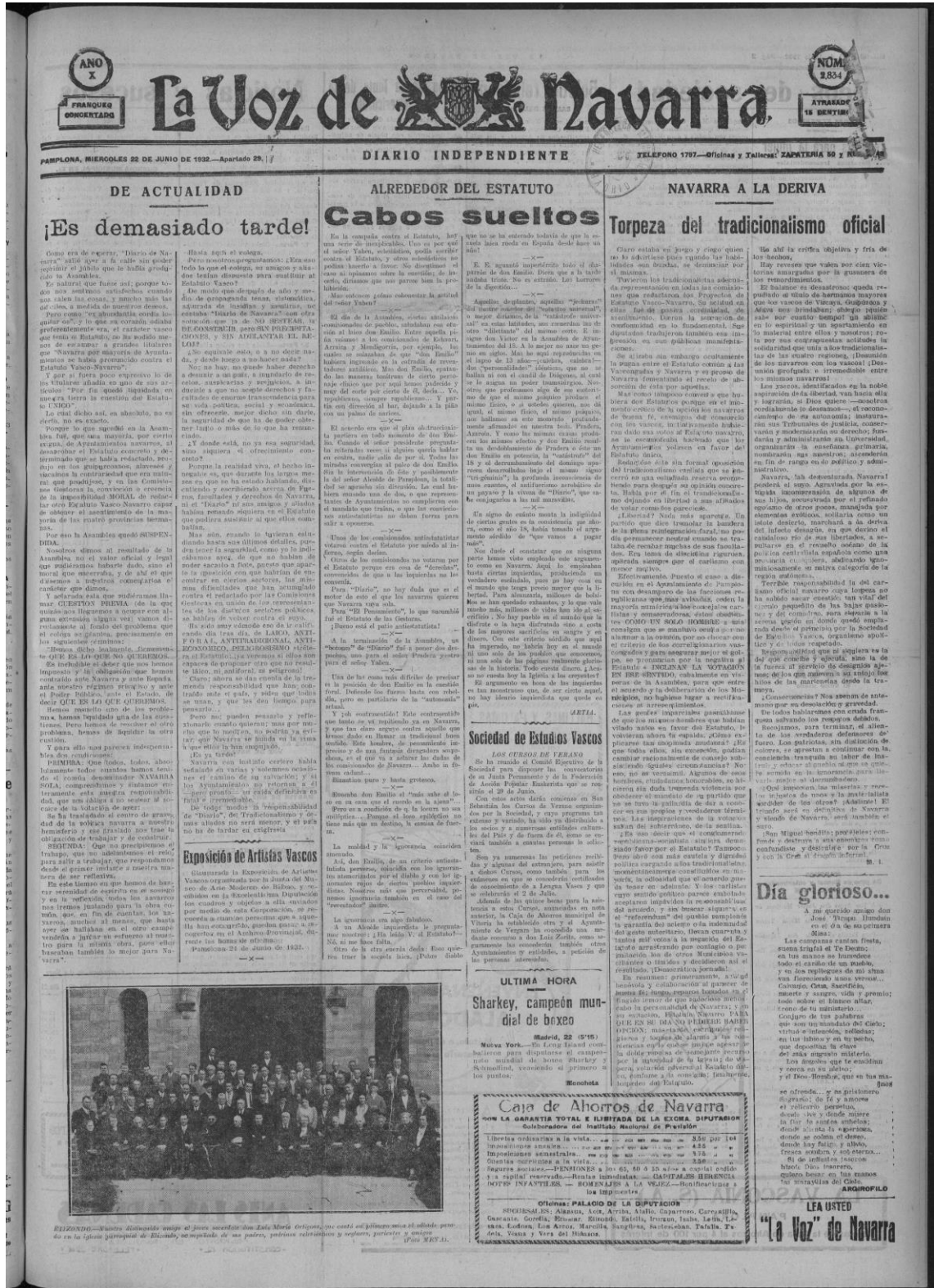
Irudia 4. La Voz de Navarra egunkaria Euskal Estatuaren inguruan egindako hainbat kritika eta berri. (La Voz de Navarra, 1932, or. 1)