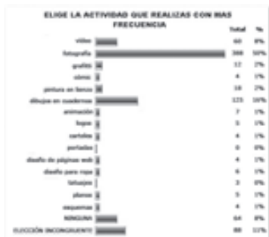
Figura 1. Índice de actividades producidas por los jóvenes encuestados

Las entrevistas realizadas corroboran este dato. De hecho, todos los jóvenes entrevistados 5 hablaron sobre fotografía como una actividad que suelen practicar.