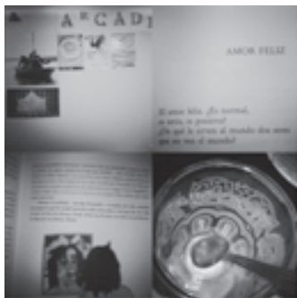
Figura 2. Cuatro fotografías realizadas por Idoia desde la aplicación móvil de Instagram

Alicia ( hablando sobre sus fotos en Instagram o Flickr ):