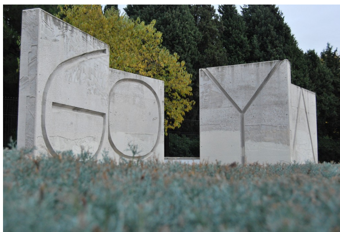
Goya , Javier de Hoyos

El sueño de la razón ; después se seleccionan las últimas pinturas de Goya como las más aptas para apoyar la intención y el propósito del autor en la escritura de esta obra en concreto. Como también señalaba Riffaterre en su artículo sobre la écfrasis, la elección de este motivo poético conlleva un elogio o encomio del objeto artístico descrito y al mismo tiempo el de su autor. De este modo, Buero elige a Goya y sus pinturas más trágicas como motivo central para la composición de una obra dramática; esta predilección por la elección de personajes públicos como protagonistas de su literatura podemos encontrarlo también en Las Meninas con Velázquez o La detonación con Mariano José de Larra. En los tres casos se trata de personas importantes para su época, dedicadas al arte y testigos de primera mano de lo que significa la falta de libertad en un entorno que resulta opresor.