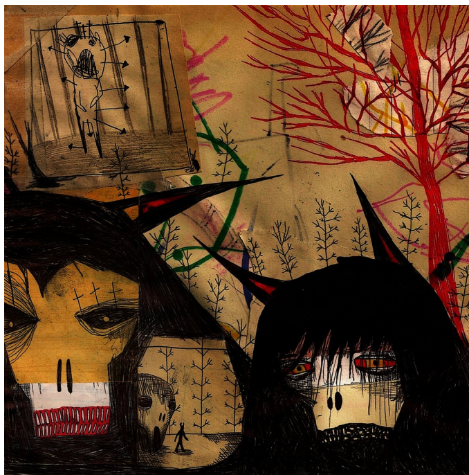
Seres extraños, Krysthopher Woods

Hay muchas interpretaciones acerca de esta obra pictórica, desde el clásico de Cronos destruyendo el tiempo hasta otras de sentido erótico. Sin embargo, para el propósito de este trabajo, me parece más acertada la visión política del mismo. Saturno puede relacionarse con el rey Fernando VII, destruyendo el país y sus ciudadanos, devorando las libertades de los españoles en un intento egoísta de mantenerse en su poder totalitario.