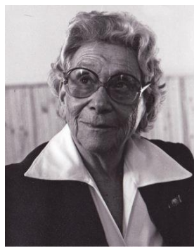
5. Irudia. 1982ko urtarrilak 9- 1984ko ekainak 6

Honi guztiari lotuta, helduak ez du inoiz haurra bere kabuz lortu ez duen postura batean jarriko. Hurrak behar duen denbora erabiliz eta horretarako prest dagoenean postura desberdinak bere kabuz ezagutzen joango da.