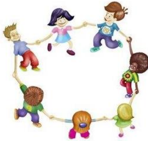
2.Irudia. Gizakia izaki soziala da