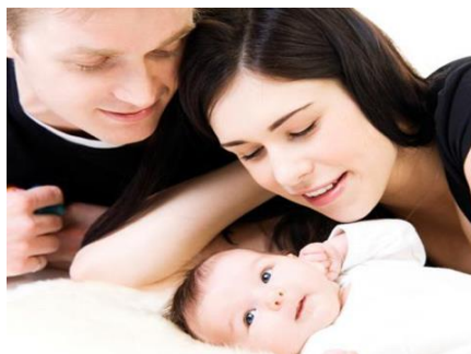
1. Irudia. Haur baten jaiotzak ardura dakar berarekin

Garaietan zehar hezkuntza eta haurren zainketa inguruko guztiak aldaketa esanguratsuak esperimintatu ditu eta horrexegatik, gauza guztietan bezala, egunen egun gaian jantzi beharra dago.