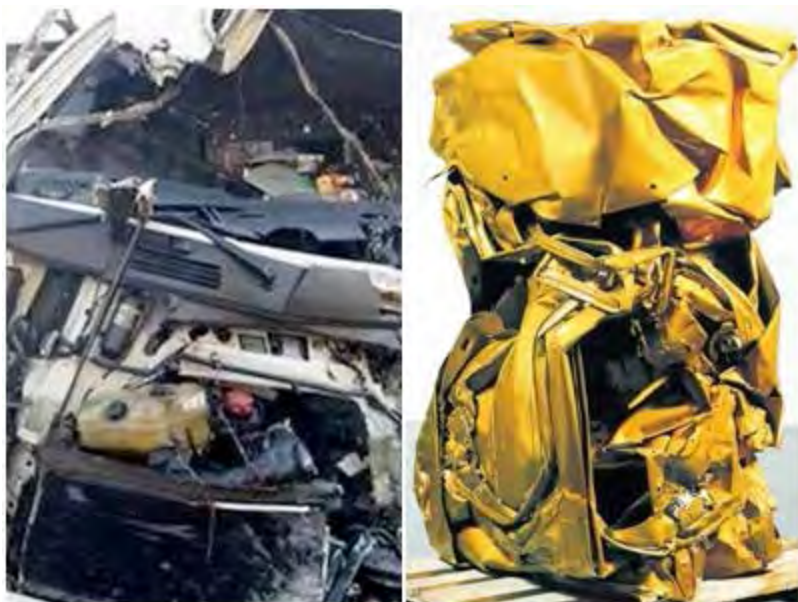
Fotografía 6: Desensamblaje-ensamblaje en un accidente de tráfico. Fotografía de la izquierda: modificada a partir de prensa regional de sucesos (accidente de tráfico con muertos en la carretera de Épila, Zaragoza, 2012); fotografía de la derecha: obra de la serie Comprensión de Cesar Baldaccini, artista plástico (tomada a partir de las fuentes citadas por Aranda, 2006).

muerte arrebatada y heridas (hilos sanguinolentos y restos humanos propios o de la víctima expulsada hasta el capó y prendados en la chatarra del coche); pero, sobre todo, habitándolo de nuevo, no tanto en una recreación del accidente, ni, por supuesto, una celebración maníaca, sino acomodándose en el nuevo habitáculo que es el coche estrujado por el empuje violento en el que lo dejó el accidente: