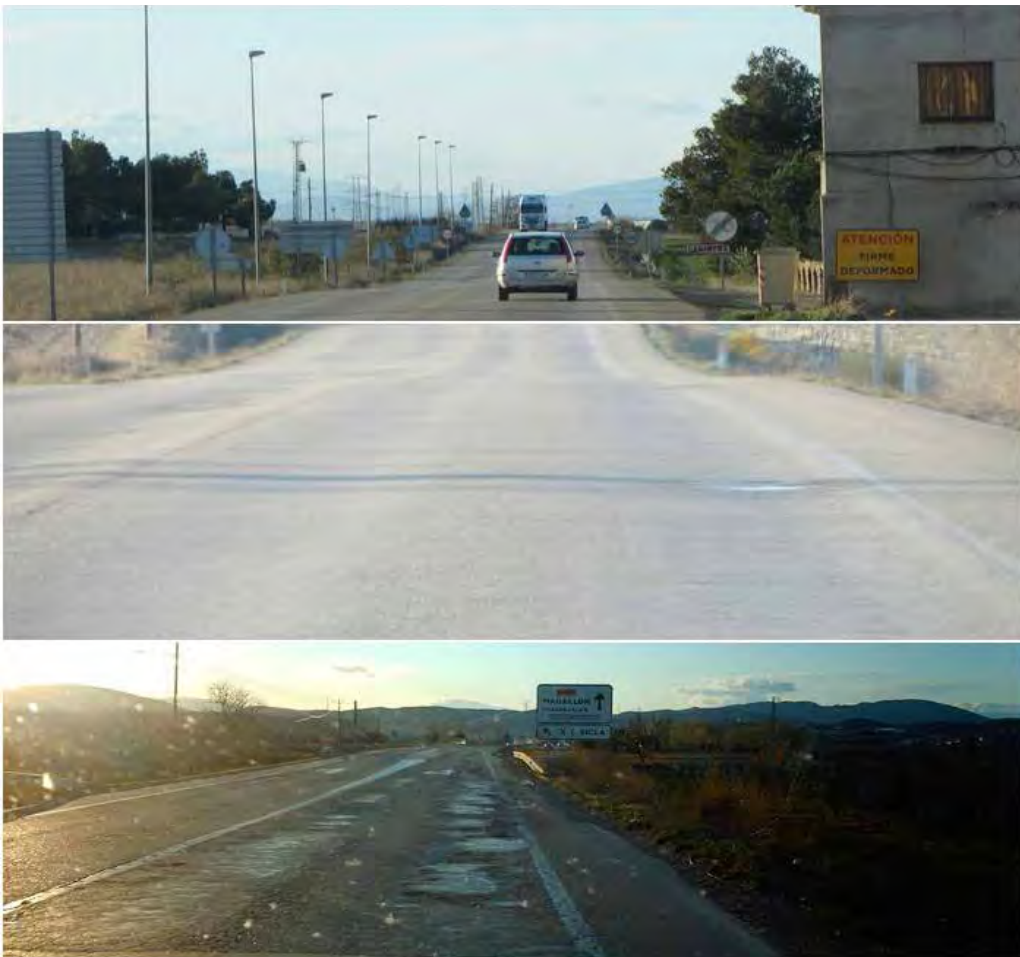
Fotografía 1. La Carretera como objeto de estudio antropológico. Firme deformado en la carretera de La Almunia de Doña Godina a Magallón, Zaragoza (2012)

bien lo distribuyó en cinco libros) nos pareció más adecuado, si bien su espontaneidad y ausencia de aparato crítico son muy limitados de aplicar en nuestro caso. Aun así y todo, la kickwriting de Kerouac (De Oto y Rodríguez, 2009/2010: 4), adaptada, ha permitido hilar todo el entramado analítico-experiencial al objeto, de manera que éste ha quedado bien cosido como máquina de la experiencia itinerante 25 . Con esto queremos hacer notar que si el objeto (el viaje) es móvil, la metodología también habría de serlo; si el objeto es producido (por la velocidad maquínica), su aparato de aprehensión, fluida (análisis de la producción metodológico-experiencial). Diásporas y nómadas 26 . Otra cuestión es la del género narrativo. La carretera aparece aquí como objeto de análisis. Pero las subjetividades del viajero acelerado por el sistema y las otorgadas a los detenidos en el camino (los habitantes y po-