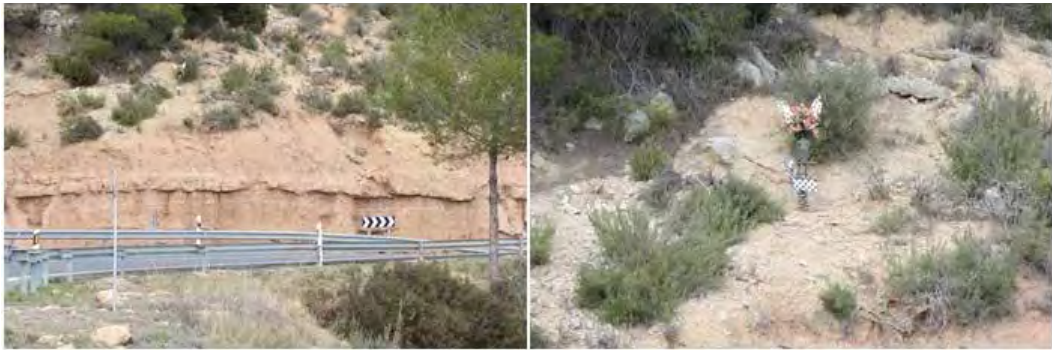
Fotografía 4: Recordatorio de muerte en accidente de carretera en una curva del alto de Cofrentes (2012): lugar y primer plano. Nótase cómo se ha conformado el altarcito con restos de lo que parece ser una motocicleta.

resultado de la experiencia cinética si relativizamos a las víctimas como productos (aunque necrofílicos) 32 de la fusión cuerpo-máquina y en cuanto la ruptura del viaje puede ser literal, obrando sobre los cuerpos, desmembrándolo en las vías en un espectáculo difuso, en un ensamblado tecnoestético (De Oto y Rodríguez, 2009/2010: 9-10) 33 . Ciertamente, leímos: