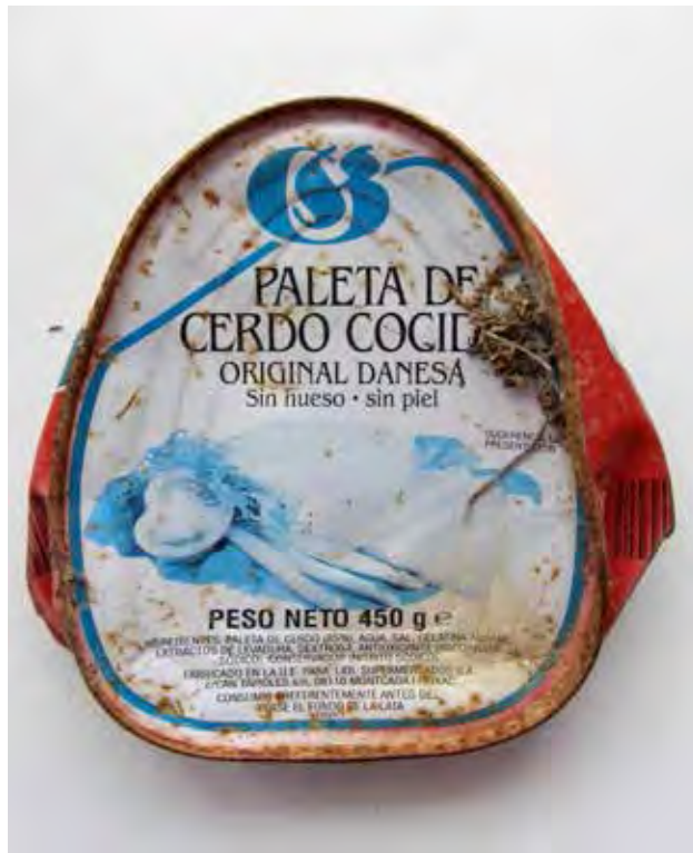
Fotografía 2: Lata oxidada recogida en lo alto de Cofrentes. 2012.

un conglomerado que funciona como gran sistema de ensamblajes humanos, mecánicos, urbanos y territoriales para la movilidad, y que atropella territorios y paisajes ubicándose en ellos y teniendo o negando acceso a los mismos en puntos de entrada y salida ficticios (arbitrarios: sobre el paisaje, la orografía y la planificación urbana y rural, o a pesar de ellos más bien). Kevin Lynch (2005) se ha preocupado inestimablemente por los deshechos y el deterioro, mencionando en especial los casos que acarrear la planificación urbana y de tránsito 29 . Estos grandes sistemas necesitan, por supuesto, ser mantenidos de una manera asidua e integral (González Sáiz, 2007). Porque este gran sistema arroja de sí (se mantiene limpio) a los seres vivos no automovilizados que atraviesan “inconvenientemente” la carretera 30 . El propio sistema dispone de una labor de mantenimiento, no sólo restableciendo la fluidez y el orden de la circulación retirando vehículos siniestrados o regulando el flujo con radares y policía, sino evacuando vertidos, desbroces y retirada de árboles caídos, desprendimientos o eliminando animales y, por supuesto, rehabilitando infraestructuras básicas (como el piso