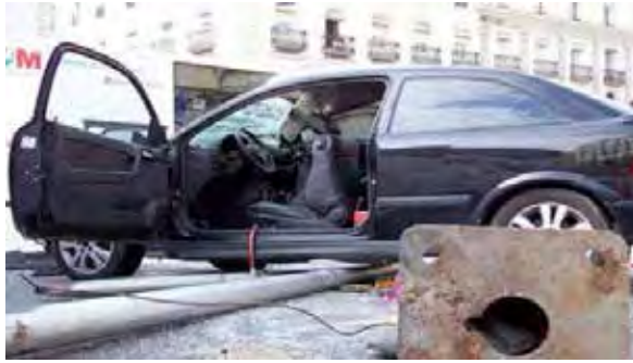
Fotografía 5: Dramatización de un accidente de tráfico en la ciudad de Madrid para la campaña de prevención de accidentes de tráfico de la D. G. T. (s. d.).

plona resulta pobre 38 . En las perspectivas morales hay algo de contradicción. Lo cierto es que las propias campañas de prevención de accidentes incluyen dramatizaciones y hasta performances muy significativas (en nuestro entorno, la promotora es la D. G. T.) que construyen y reconstruyen el accidente como un evento publicitario que explora sensibilidades concretas (un recurso supuestamente concientizador) 39 . Tejero y Chóliz (1995) evalúan las reacciones emocionales frente a estas campañas publicitarias de prevención. La “crudeza” y el “realismo” de las consecuencias perniciosas como forma de persuasión de conductas inapropiadas en la conducción son recreadas por medios dramáticos. Curiosamente (o no tanto), la evaluación (además de frente a un grupo control con estímulos relativos a la juguetería y la alimentación), es comparada con campañas publicitarias menos amenazantes pero más sugestivas, como las de consumo de profilácticos y perfumes. Una banalidad experimental que algo tiene que ver con la idea del coche y el viaje de carretera como frenesí sexual de las novelas de Ballard y Kerouac 40 .