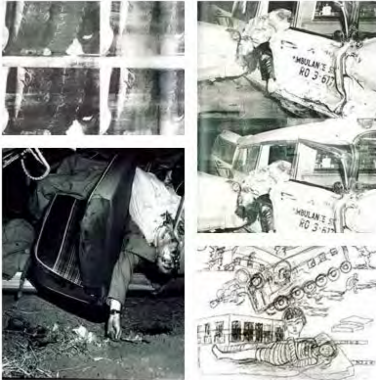
Fotografía 7: En el sentido de las agujas del reloj, “Pie y neumático”, y “Ambulance disaster” de Andy Warhol, ambos de 1963; “Accidente”, de Frida Kahlo, 1926; e instantánea de Mell Kilpatrick (tomadas de Aranda, 2006).

seguridad y control, sino que ha fabricado un enorme arsenal de elementos, donde el cable, el vidrio, el acero, e incluso las propias técnicas de comunicación, le inscriben con toda propiedad en aquél” (Herce, 2001: 65). El arte contemporáneo no ha renunciado a explorar estos eventos. Mell Kilpatrick ( Car crashes & other sad stories , 2000) en los años cuarenta; Andy Warhol ( Ambulance disaster , 1963; Accidente automovilístico blanco 19 veces , 1963; Pie y neumático , 1963; etc.) en los sesenta; y un considerable elenco de artistas pop y post, así como escritores y cineastas (Frida Kahlo, Robert Rauschenberg y John Cage, John Chamberlain, Jacques Monory, Cesar Baldaccini, J. G. Ballard, Kerouac, David Cronenberg, etc.) (Aranda, 2006).