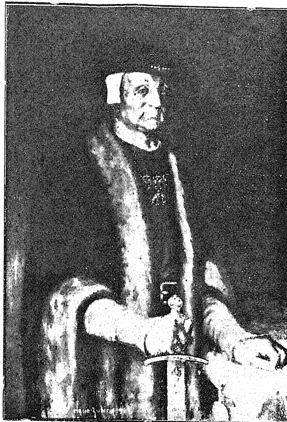
EL REY CARLOS III EL NOBLE DE NAVARRA

Los trabajos del Rey y de los Procuradores tuvieron feliz resultado y el día 8 de Septiembre de 1423,