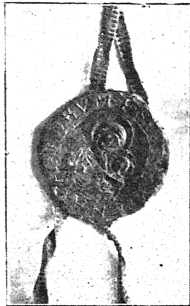
☐☒☐ Núm. 1 Sello de la Navarrería Anverso ☐☒☐

El Burgo de San Cernin , se pobló, según el Príncipe de Viana, de gente francesa que el Rey Felipe de Francia expulsó de Cahors. El mismo nombre de San Cernin, conservado todavía hoy en Pamplona para designar a la iglesia de San Saturnino, es indicio de que los moradores de ese barrio procedían del Languedoc, en el mediodía de Francia.