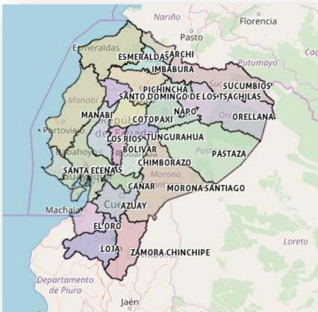
Figura 1: Mapa de la ubicación territorial de la Provincia de Morona Santiago, Ecuador

El presente programa se va a implementar en la República del Ecuador, que se halla situada en la costa noroccidental de América del Sur, en la zona tórrida del continente americano. Al territorio nacional le atraviesa la línea ecuatorial, precisamente 22 Km al N de la ciudad de Quito, que es su capital. (7) Si miramos al interior de Ecuador, la intervención del programa será en la provincia de Morona Santiago, se encuentra localizada en el centro sur de la región Amazónica, forma parte de la cuenca amazónica sudamericana, que, con su enorme superficie, 7.5 millones de kilómetros cuadrados y complejidad ecosistémica, es la más importante reserva biótica existente en el mundo. Corresponde al 19.35% de la superficie provincial y el 4.02% con respecto a la Región Amazónica Ecuatorial, RAE.