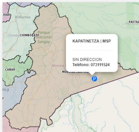
Figura 2: Mapa de la ubicación del Centro de Salud Kapatinetza