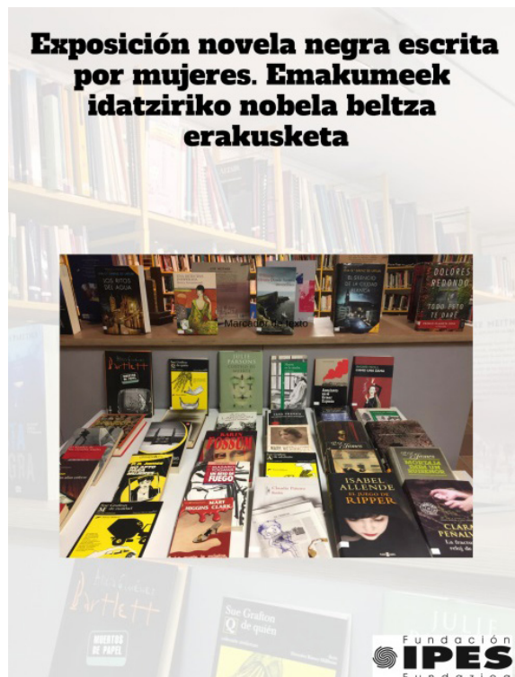
Figura 3. Cartel anunciador de la exposición novela negra escrita por mujeres en el Centro de Documentación-Biblioteca de Mujeres de IPES.

Con el fin de difundir las diferentes temáticas que recorren los feminismos y los estudios de género y los materiales que sobre ellas existen en el Centro, a lo largo del año se realizan exposiciones temáticas, o bien asociadas a efemérides reivindicativas, tres fundamentalmente: las del 8 de marzo o el 25 de noviembre o debates existentes en el feminismo clásico o más asociados a la cuarta ola (prostitución, feminismos y LGTBI, etc.); o bien a cuestiones directamente relacionadas con la promoción del libro o corrientes literarias de especial interés, como el día del libro o la novela negra por ejemplo. Las exposiciones monográficas pueden seguirse tanto presencialmente en la propia biblioteca como virtualmente a través de nuestro blog.