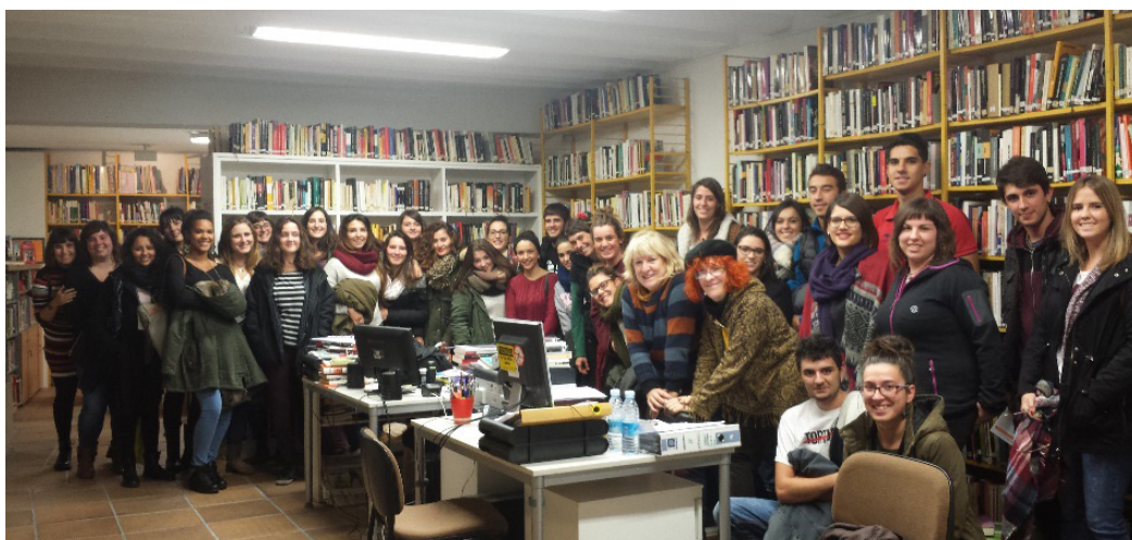
Figura 2. Alumnado del Grado de Trabajo Social de la Universidad Pública de Navarra (UPNA)

Las visitas guiadas en el Centro de Documentación-Biblioteca de Mujeres de IPES son una forma de asesoramiento tanto histórico (historia de las mujeres para conseguir la igualdad de derechos, emergencia de los estudios de género, surgimiento de los centros de documentación especializados en esta perspectiva, etc.), como del propio centro, de sus materiales y de los servicios que este ofrece.