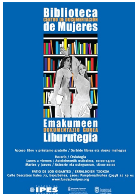
Figura 1. Folleto de la Biblioteca de la Fundación IPES.