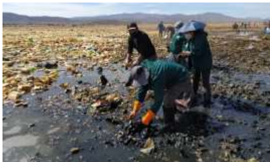
Fotografía 2.- Playón de ingreso del lago Uru Uru