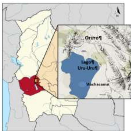
Fig. 1 Ubicación del lago Uru-Uru, departamento de Oruro - Bolivia.

El lago Uru Uru, está formado por el desborde del río Desaguadero en su desembocadura en el lago Poopó, sobre la extensa planicie sedimentaria denominada "Santo Tomás". Esta formación data de 1962. El río Desaguadero conecta el lago Titicaca y el lago Poopó. Tiene una longitud de 21 km y una anchura de 16 km, y una superficie de 214 km 2 a una altura de unos 3695 msnm. La figura 1 muestra la ubicación geográfica del lago Uru Uru.