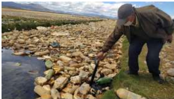
Fotografía 1.- Canal de ingreso de aguas al lago Uru Uru