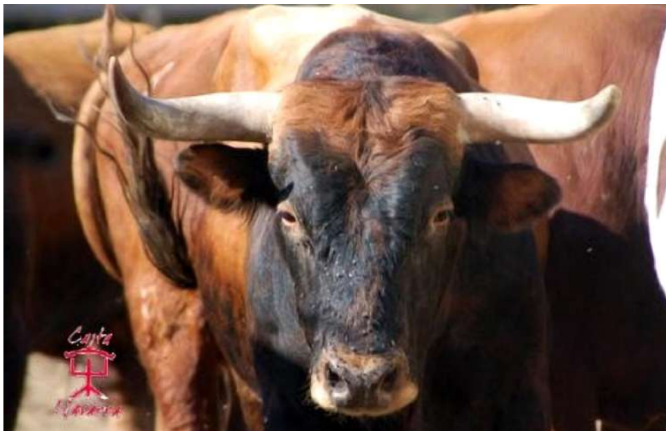
Toro de Casta Navarra