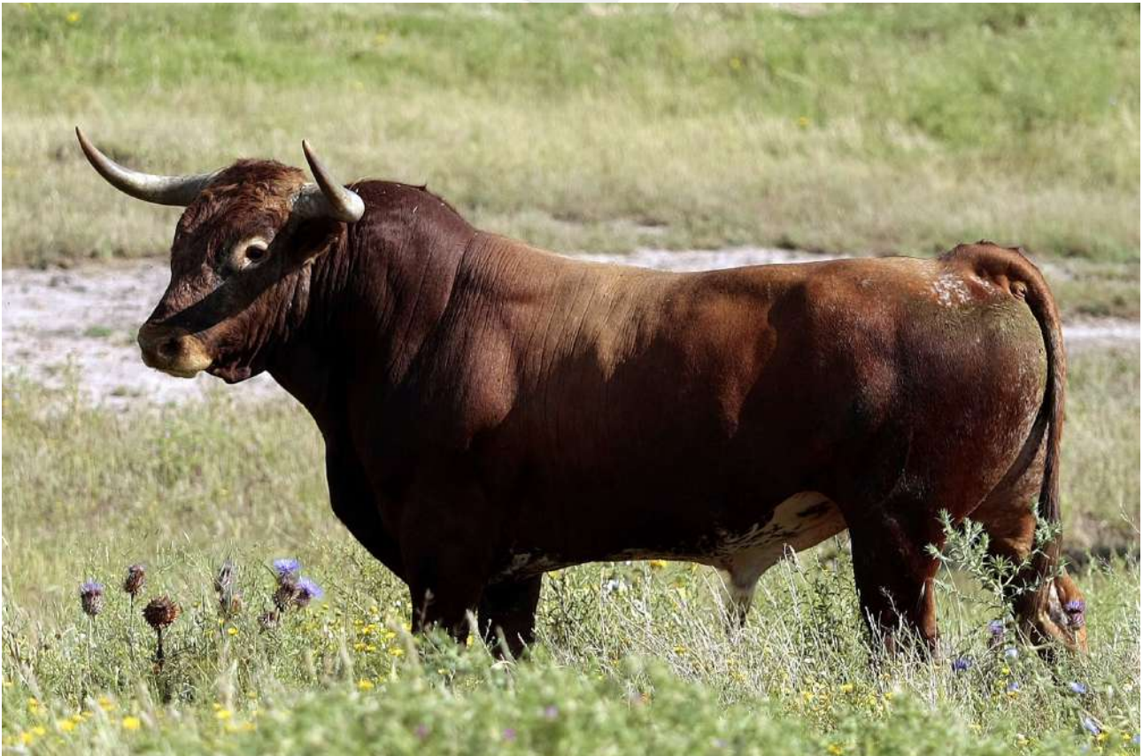
Toro de Miura en Zahariche.

Por todo ello, no es extraño que muchas personas consideren al toro bravo como el eje central sobre el que giran los Sanfermines, solo superado por la fuerza que imprime San Fermín, patrono de Navarra (junto con San Francisco Javier), y a los que todos se pliegan, pamplonicas y forasteros, cuando llega el siete de Julio de cada año, día del patrón. Lamentablemente, los Sanfermines de este año 2020 no los podremos vivir y disfrutar. ■