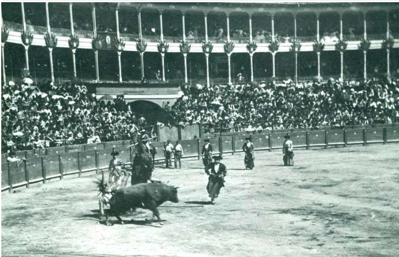
Corrida de toros en la vieja plaza de Pamplona, con toros de Casta Navarra.

tenían mayor temperamento, mayor fiereza, para darle mayor emoción a sus ritos y a sus juegos. Además, su menor tamaño y peso les permitía moverse con mayor agilidad y revolverse en un palmo de terreno.