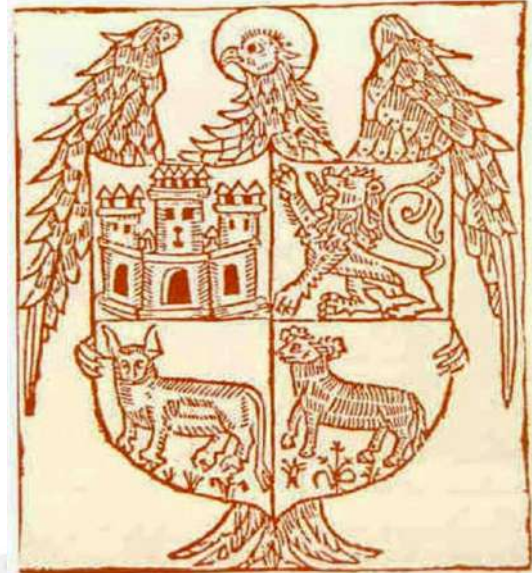
Escudo del Honrado Concejo de la Mesta.

Al ser España un país de orografía difícil, por estar surcada por numerosas cordilleras y sistemas montañosos, y al poseer un clima continental con inviernos fríos y veranos muy calurosos y secos, las razas locales que se crean son de tamaño y peso menores que las centroeuropeas que, por lo general, viven en medios más favorables. Es por ello, que España da carta de naturaleza al sistema de trashumancia con la creación por Alfonso X El Sabio del Honrado Concejo de la Mesta en 1273, para regular y favorecer el pastoreo de los rebaños de ganado vacuno y de ovino, principalmente. Los animales pasaban los inviernos protegidos en las partes bajas de Extremadura y de Andalucía y subían a los pastos frescos de montaña de la vieja Castilla en los meses de primavera y verano, a través de las vías pecuarias llamadas cañadas reales (cañadas, cordeles, veredas), que sur-