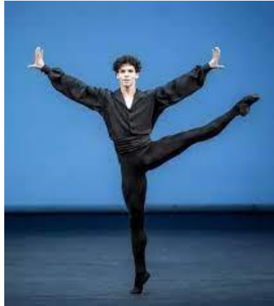
Balleteko dantzari mutilaren eredia Notiamerica, 2020

https://www.notimerica.com/sociedad/noticia-isaac-hernandez-bailarin-mexicano-mas-famoso-mundo-20170820082555.html