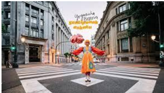
Erabilitako lehenengo abestia, sentipenak askatu (Yogurinha Borova), Gordiscos, 2019.

https://www.youtube.com/watch?v=R5mBaKmx39o