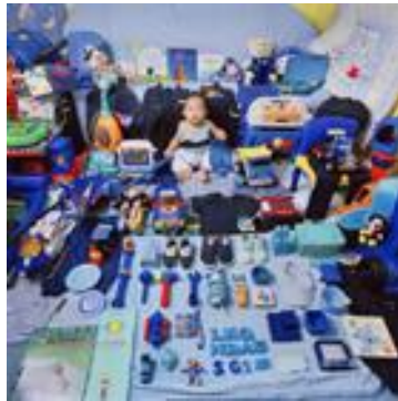
The Pink & Blue Project, mutilen irudia , JeongMee Yoon, 2005, Artworks,

http://www.jeongmeeyoon.com/aw_pinkblue.htm