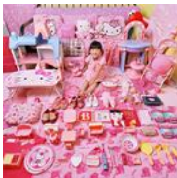
The Pink & Blue Project, nesken irudia, JeongMee Yoon, 2005, Artworks,

http://www.jeongmeeyoon.com/aw_pinkblue.htm