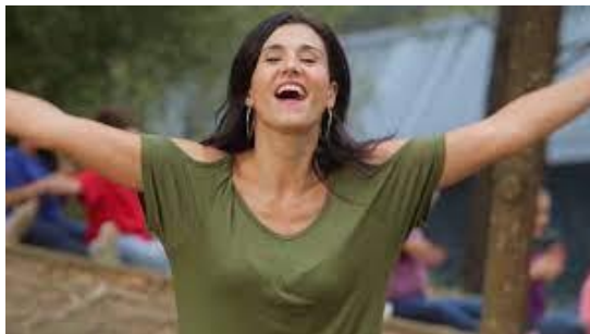
Erabilitako bigarren abestia, nire gorputza da (kantu kolore), Kantu kolore, 2017.

https://www.youtube.com/watch?v=aE3CYQoE7I